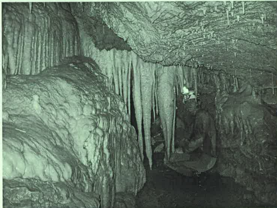
Sardegna 2001 - Su Palu